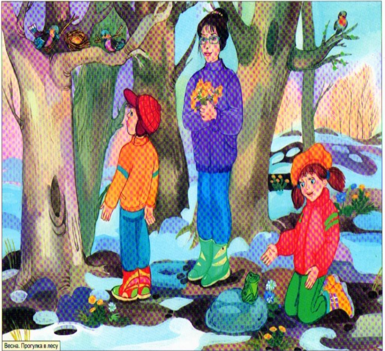
Весна. Прогулка в лесу